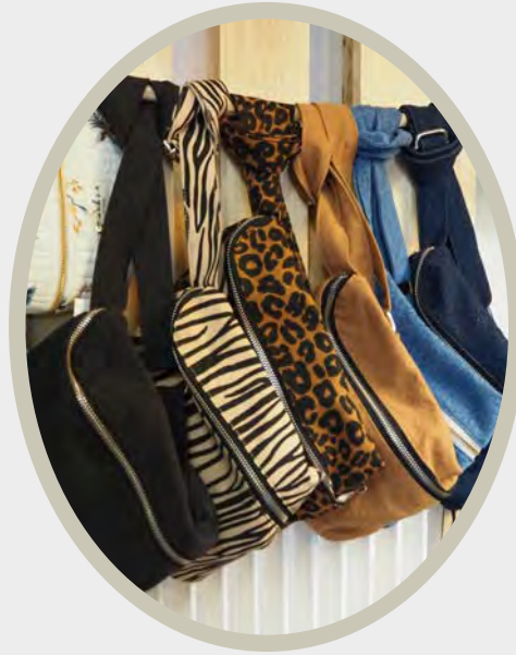
RIVE DROITE Custine - Le sac banane 60 - 75 € selon modèle