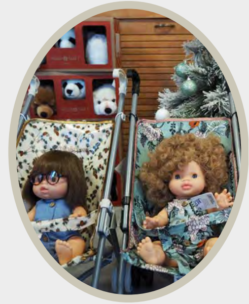
MINIKANE Poupée 52,90 - 69,90 € selon modèle

Concernant votre présence sur les réseaux sociaux, quels sont les réseaux que vous utilisez pour promouvoir votre boutique ?